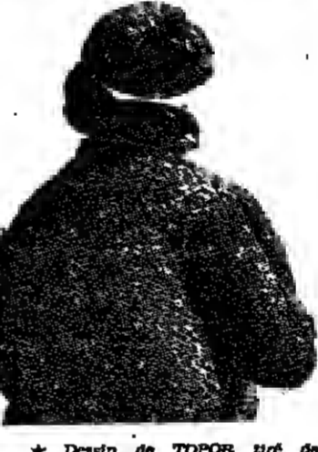
★ Dessin de TOPOR tiré de Toporland.

ROLAND TOPOR est un homme dangereux, car il pratique le sarcasme avec une allégresse cruelle, s'éparpillant moins encore lui-même que les autres. Et le lecteur est souvent touché au vif, se reconnaissant malgré lui dans les portraits que cet auteur fait de soi et de ses contemporains. Qu'il écrive ou qu'il dessine, Topor ne lâche à la complaisance aucun refuge, ne donne aucune chance à l'illu- sion. Le volat, nu, misérable. Et nous avec. Mais n'allez pas croire qu'il verse dans la complaisance. La raillerie marque tous ses aveux. Sa pudeur l'y entraîne.